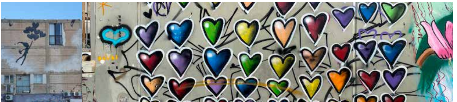
Street Art in Tel Aviv, Israel, fotografiert auf der Austauschfahrt im März 2022.