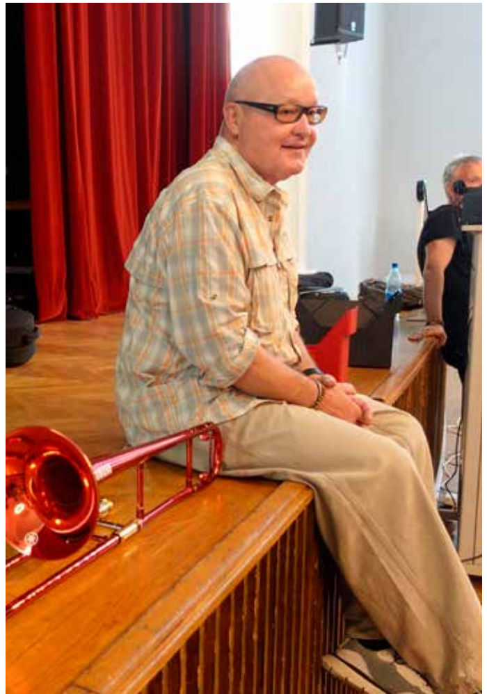
Nils Landgren („Mr. Red Horn“)

Die erste Begegnung erfolgte im Workshop in der Aula der HHS. Die Bläserklasse 6 spielte zur Begrüßung den „F-Jam-Blues“, woraufhin Herr Landgren direkt bei Betreten der Aula seine Posaune auspackte und in die Jam-Session einstieg, was bei den Schülerinnen und Schülern großes Staunen und Begeisterung auslöste. Sofort entstand eine gelöste und lockere Atmosphäre, die sich